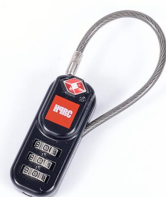
[ HPRCLO ]